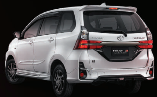
1.5 A/T Type