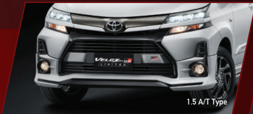
1.5 A/T Type