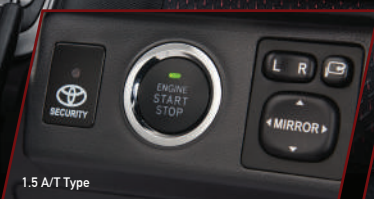
1.5 A/T Type

All Black Spirited Ambience Dashboard Design with Fine Seat Color Cover (All Type)