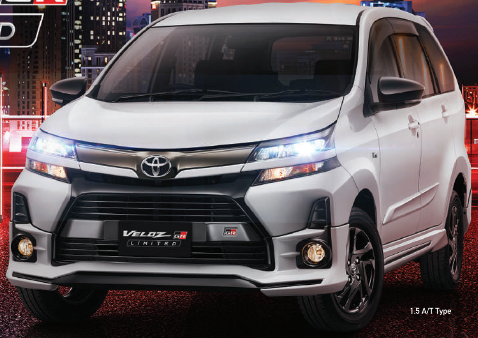
1.5 A/T Type