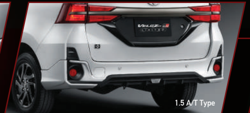
1.5 A/T Type