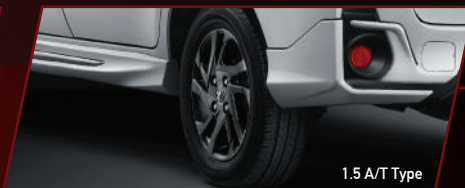
1.5 A/T Type