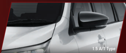
1.5 A/T Type