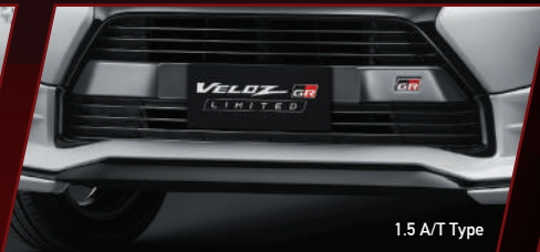
1.5 A/T Type