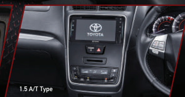
1.5 A/T Type